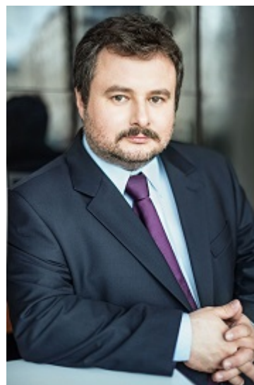
Komentarz Prezesa UOKiK Marka Niechciała

Zobacz więcej materiałów multimedialnych